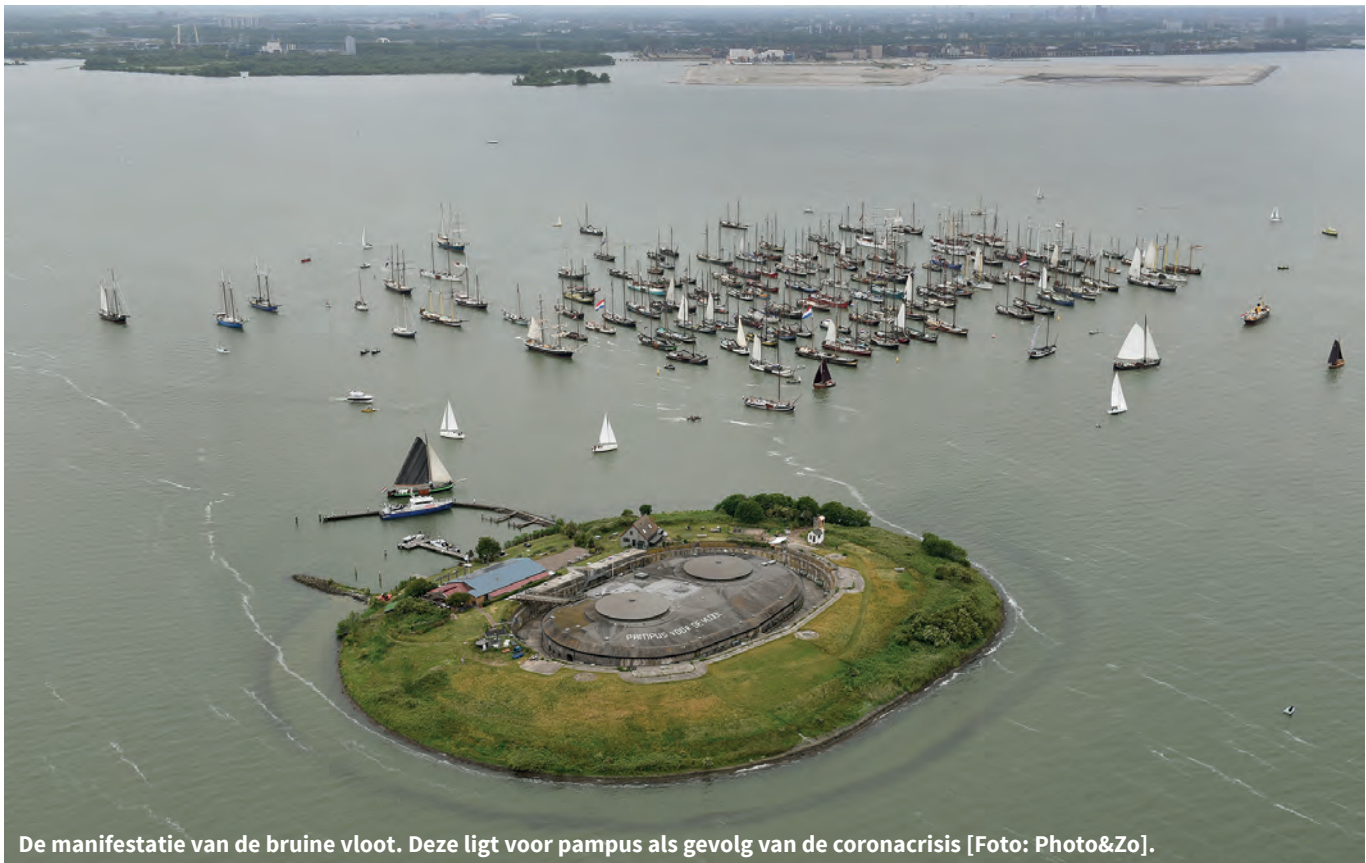
De manifestatie van de bruine vloot. Deze ligt voor Pampus als gevolg van de coronacrisis.

zeilen. Met ruime wind zoekt De Bontekoe over het IJmeer. Golven bewegen in de richting van de eindbestemming met slierten witte belletjes. Aan de horizon prijkt de nieuwe witte spoorbrug van Muiderberg.