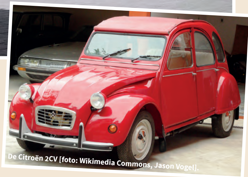
De Citroën 2CV.