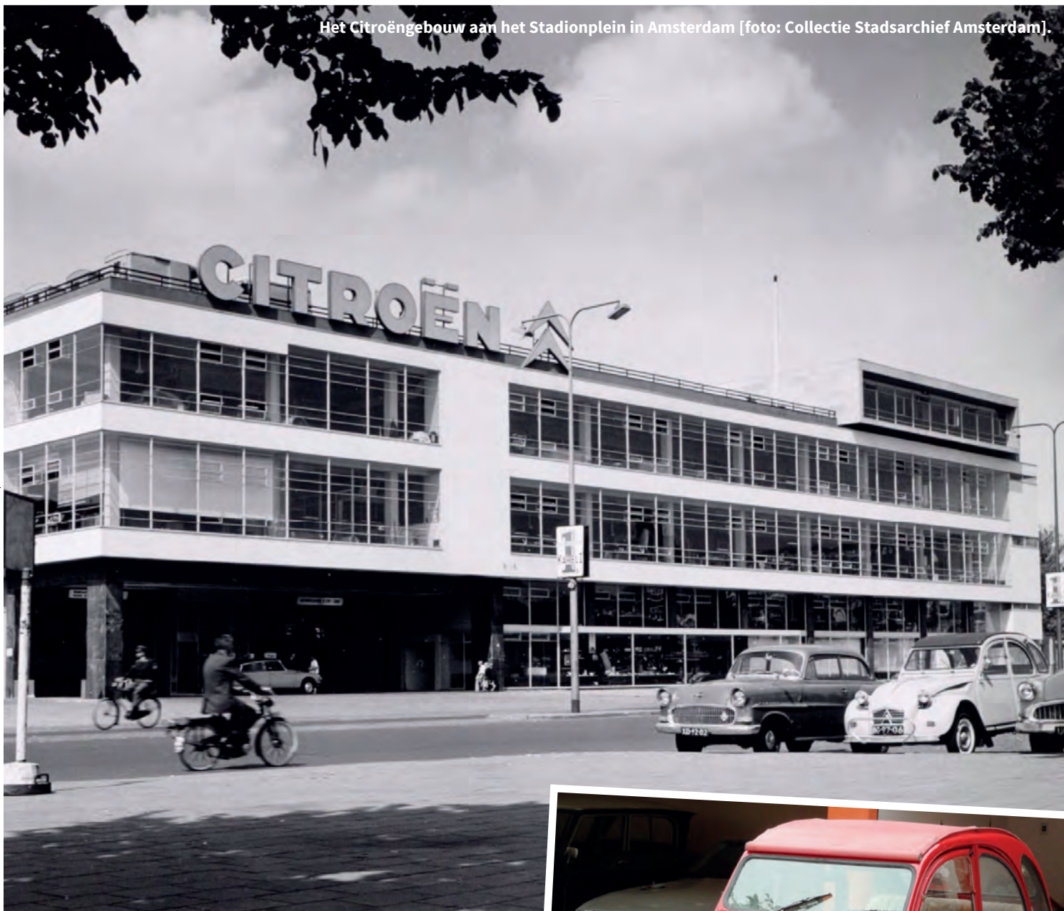
Het Citroëngebouw aan het Stadionplein in Amsterdam.